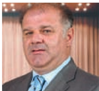
L'assessore veneto alla Caccia, Daniele Stival

Il Consiglio regionale del Veneto torna a riunirsi, dopo la pausa d'agosto, giovedì 9 settembre con eventuale prosecuzione anche venerdì 10 settembre: i lavori ripartono da dove si erano interrotti il 5 agosto scorso, cioè dall'esame della proposta di poter cacciare, a partire dalla terza domenica di settembre, anche storni, fringuelli, prispolone, pispola, frosone e peppole, specie volatili protette ma per le quali la normativa europea consente alcune possibilità di