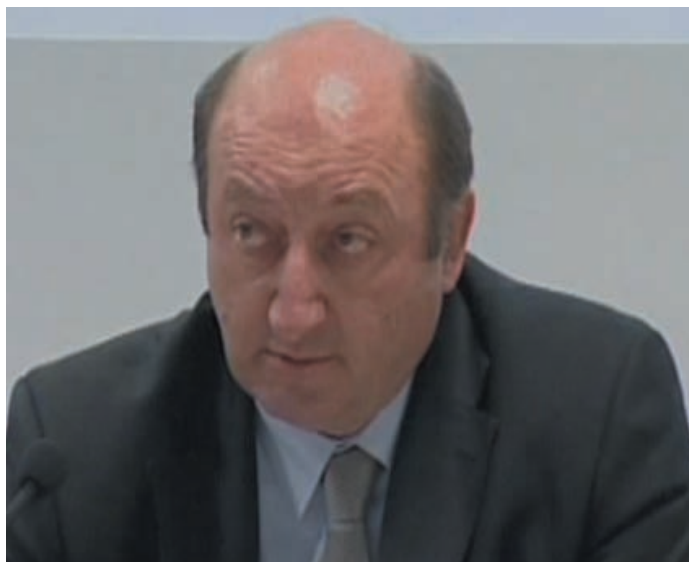
L'assessore regionale all'Economia, Vendemiano Sartor

Pur confermando di aver rilevato un effettivo aumento di ordini e commesse, i datori di lavoro del Veneto dichiarano di voler attendere segni più stabili e duraturi di una reale ripresa del mercato prima di procedere all'ampliamento della propria struttura. Risultato: la previsione di occupazione nella regione raggiunge quota -11%, con una misurata flessione di 2 punti percentuali rispetto ai primi tre mesi del 2010 e di 8 punti rispetto allo stesso periodo del 2009. "Le aziende hanno bisogno di ripensare in molti casi come stare sul mercato, anche perché in molti Paesi