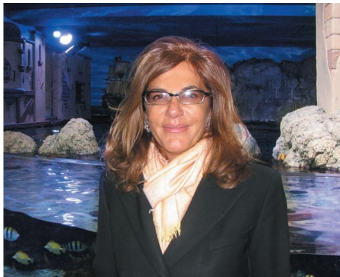
il presidente di Confindustria Emma Marcegaglia

ospita ben 5000 esemplari di oltre 100 diverse specie - e per le curiose storie raccontate su cavallucci marini - di cui ha assistito all'alimentazione - pesci scorpione, murene, cernie giganti, e leoni marini. Grande suggestione ha suscitato il tunnel oceanico con le razze giganti che scivolavano sinuose come per farsi accarezzare accanto gli squali nutrice e ai pesci coloratissimi. Mamma Emma e papà Roberto hanno apprezzato il lavoro e l'accoglienza dello staff e la scenografia dell'Acquario - che hanno ritenuto a misura di bambino - e sostenuto la campagna di sensibilizzazione "STOP WHALING"